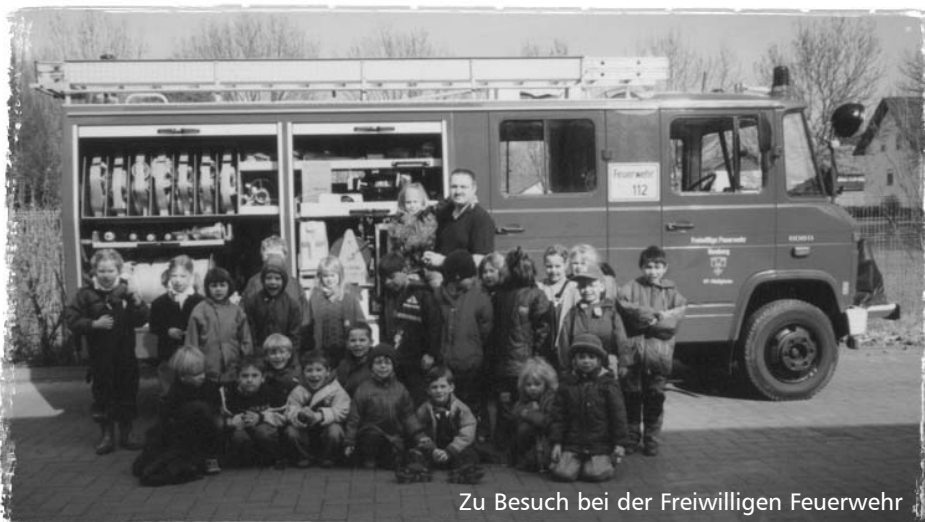
Zu Besuch bei der Freiwilligen Feuerwehr

Die Erzieherinnen des Tabalugalandes hatten alle Schulanfänger zu einer „Mega-Abschiedsfeier“ auf das Gelände des Vogelschutzvereines eingeladen. Bevor die Party ins Rollen kam, trafen sich alle Schulanfänger mit ihren Vätern am Lehrerparkplatz der Erich-Simdorn Schule. Von dort aus begaben sich fünf kleine Gruppen auf eine geheimnisvolle Expedition. Mit dem Rucksack und Verpflegung ging es auf den Pfaden von Schulkindern Richtung Ravolzhausen. An der Kita Brüder-Grimm wurde die erste von fünf Aufgaben gelöst. Für jede gelöste Aufgabe bekamen die Gruppen-