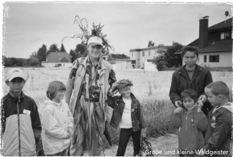
Große und kleine Waldgeister

fürher ein Wort als Belohnung. Bei der letzten Station am Ende des Wäldchens waren aus manchen Vätern Waldgeister geworden. Nun war die letzte Aufgabenstellung aus den Wörtern: Tabaluga, Zeit, Schule, groß und Spaß ein Gedicht zu verfassen. Die Expeditionsmitglieder wurden schon von allen Mamas und Geschwisterkindern am Gelände des Vogelschutzvereines erwartet. Hier stärkten sich erst mal alle mit Steaks und Bratwürstchen. Die Muttis hatten ein supertolles Salatbuffett aufgestellt. Danach haben alle fünf Expeditionsgruppen ihr Gedicht nicht aufgesagt, sondern zur Melodie von „Alle meine Entchen“ vorgesungen. Auch die Muttis hatten die Zeit genutzt und ein Gedicht mit den gleichen Worten verfasst. Nach den wirklich lustigen Beiträgen suchten die Kinder noch die verborgene Schatzkiste und sangen ihr Kindergarten-