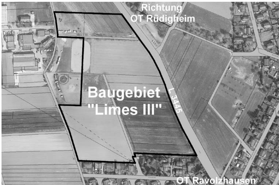
Das neu ausgewiesene Bauland „Limes III“ zwischen den beiden Ortsteilen

Ebenfalls hat die Gemeindevertretung in der Sitzung am 16. Juli 2003 einen neuen Verkaufspreis für Bauland festgesetzt. Dieser beträgt mit sofortiger Wirkung 200,- Euro pro Quadratmeter.