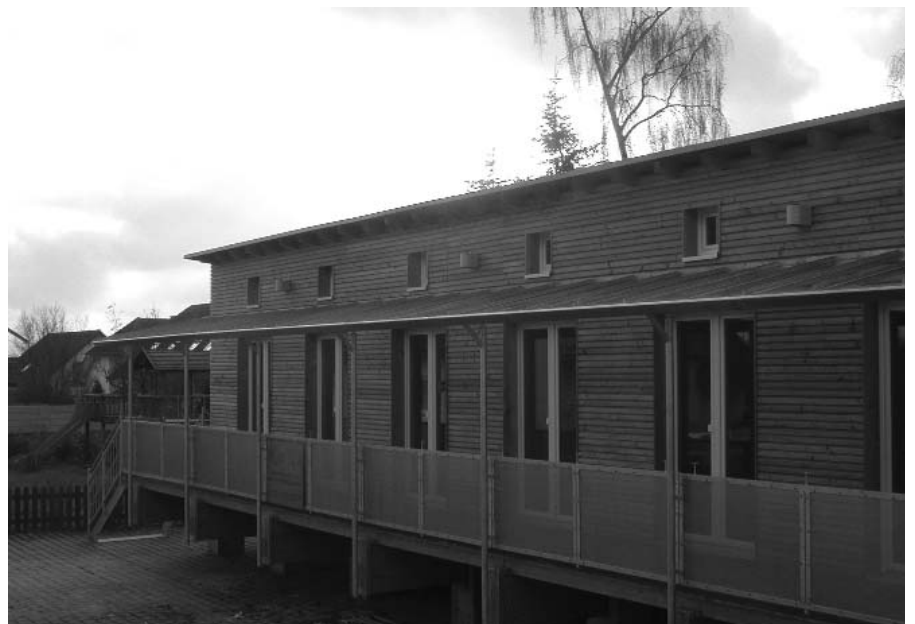
Der Neubau am Kreisel bietet Platz für 25 kleine „Brummkreisel“

Um die neuen Räume der Öffentlichkeit zu präsentieren, ist für Ende Januar ein „Tag der offenen Tür“ geplant; der genaue Termin wird rechtzeitig bekannt gegeben.