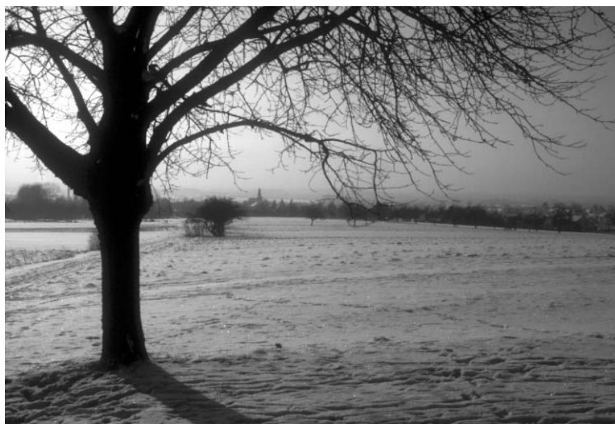
Blick auf das winterliche Ravolzhausen