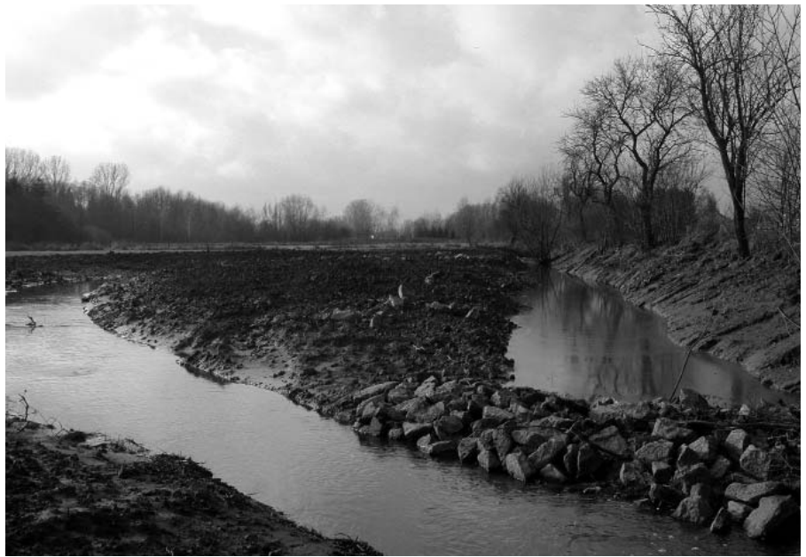
Die Fallbachaue unmittelbar nach Abschluss der Renaturierungsmaßnahmen

■ Die Idee, den Fallbach naturnah umzugestalten wurde vor etwa 20 Jahren geboren. Ein Ingenieurbüro fertigte bereits damals erste Planungen an, die jedoch auf Grund der relativ hohen Kostenlast für die Gemeinde - die Kosten der jetzt abgeschlossenen Maßnahmen belaufen sich auf rund 200.000 Euro - nicht umgesetzt wurden. Nachdem das Land Hessen in diesem Jahr die Renaturierung durch eine großzügig ausgelegte Förderung unterstützte, konnte die Gemeinde Neuberg die naturnahe Umgestaltung der Fallbachaue zwischen der L3445 und der A45 erfolgreich abschließen. Durch die Vernetzung des Fallbachs mit seiner Aue ist ein Beitrag zur dringend notwendigen Hochwasserschutzmaßnahmen erfolgt. Bürgermeister Uwe Hofmann und die zukünftige Neuburger Bürgermeisterin Iris Schröder konnten sich mit dem beauftragten Architekten Thomas Egel von der Planungsgruppe ZEG aus Hanau von den gelungenen Arbeiten nach eineinhalbjährigen Planungs- und Bauphase überzeugen. „Wir hatten nach intensiven Gesprächen mit den beteiligten Stellen unsere Grundstücke für die öko-